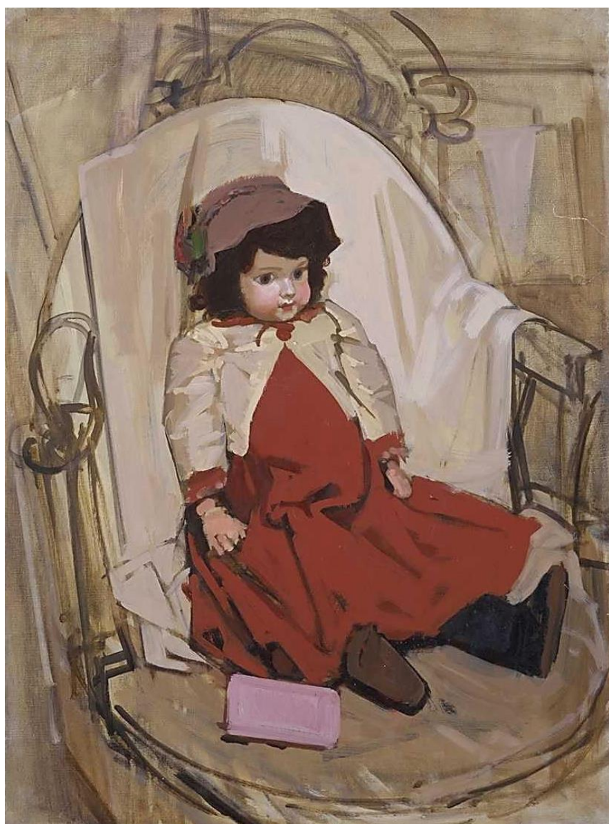
小磯良平《人形》1970年 油彩 神戸市立小磯記念美術館蔵 (コレクション企画展示「人形(ひと)を描く-小磯良平と西洋人形-」(2020年2/6~4/5)で公開)

昭和を代表する 洋画家・小磯良平の 画業と、神戸市立小磯記念 美術館のコレクションに ついて詳しく解説します。