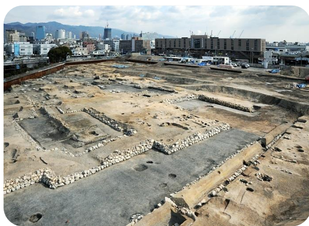
兵庫津遺跡 第62次調査 姿を現した兵庫城